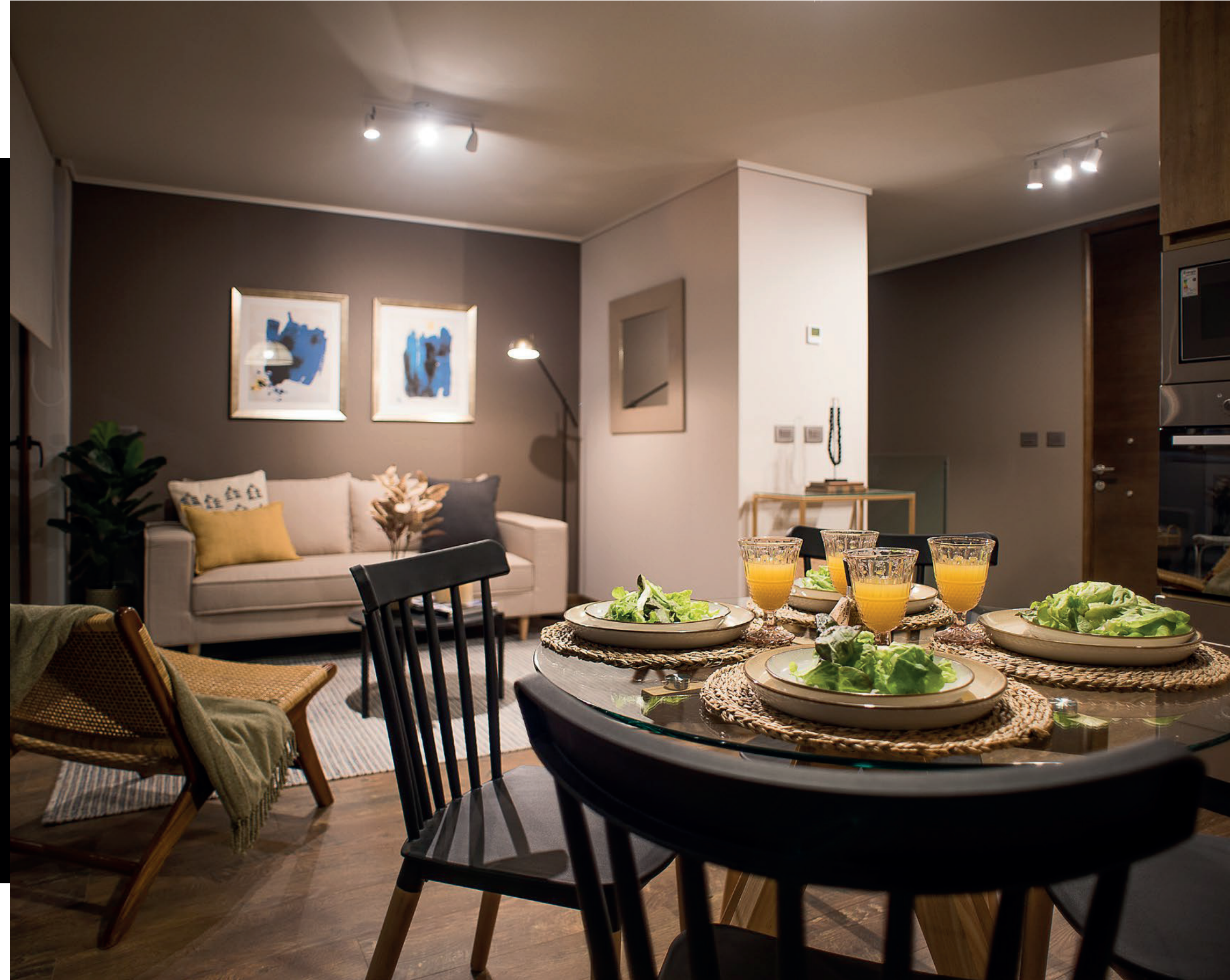
Imagen corresponde a Depto. C2