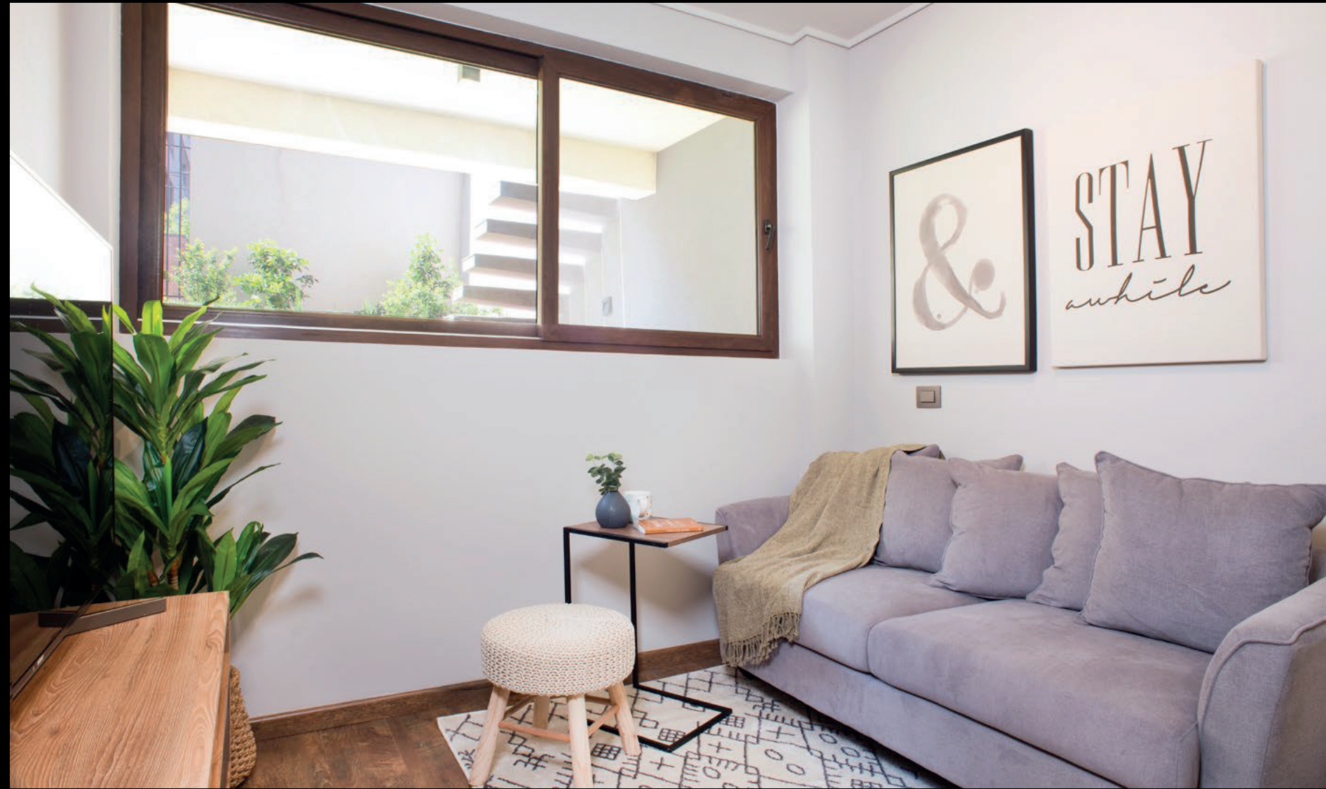
Imagen corresponde a Depto. C2