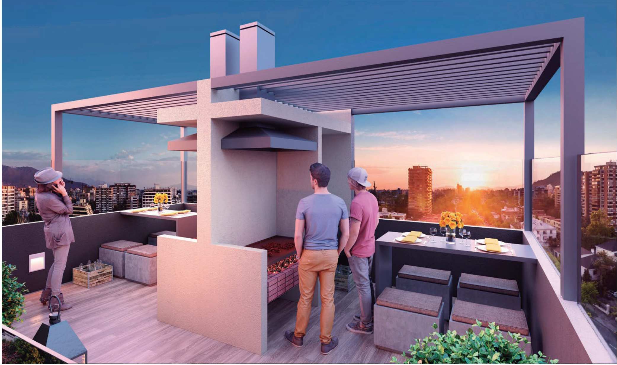
Imagen referencial del Quincho