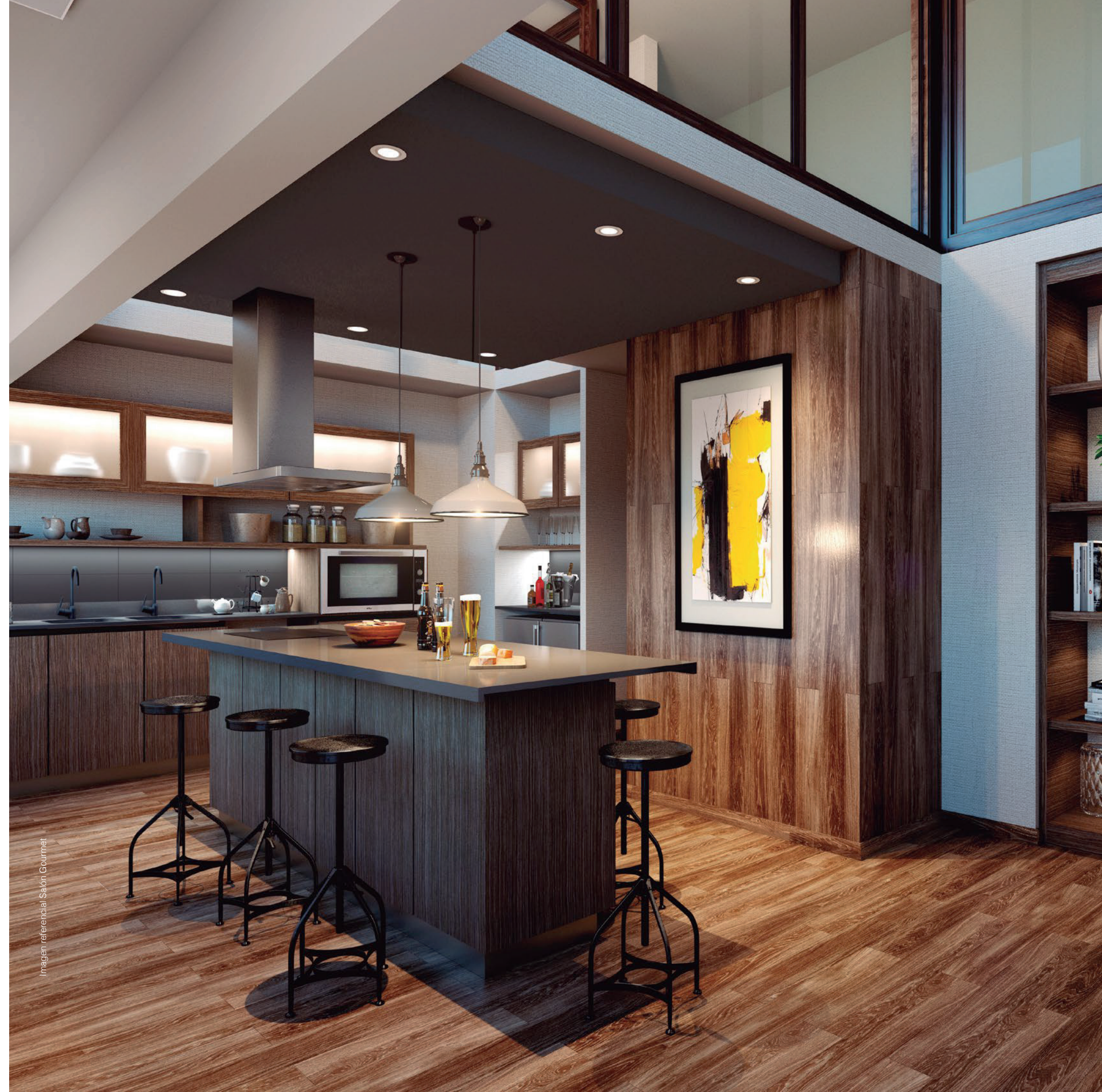
Imagen referencial Salón Gourmet